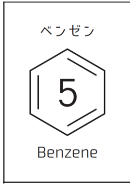
図 1 ベンゼン環カード