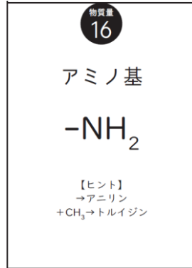
図 2 官能基カード